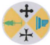
Tabella riepilogativa dei principali adempimenti in materia di trasparenza, anticorruzione e ciclo di gestione della performance - Regione Calabria ed enti strumentali sottoposti all'OIV della Giunta regionale in base all'art. 2, comma 2, legge regionale 3/2012 e all'art. 13, comma 8, l.r. 69/2012 1 (aggiornamento al 15 luglio 2016)