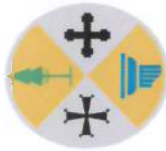
Tabella riepilogativa dei principali adempimenti in materia di trasparenza, anticorruzione e ciclo di gestione della performance - Regione Calabria ed enti strumentali sottoposti all'OIV della Giunta regionale in base all'art. 2, comma 2, legge regionale 3/2012 e all'art. 13, comma 8, l.r. 69/2012 1 (aggiornamento al 15 luglio 2016)